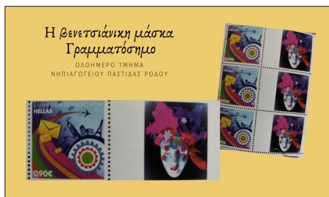
Εικόνα 4. Γραμματόσημα με την βενετσιάνικη μάσκα, Ν/γείο Παστίδας Ρόδου

Όλες οι δραστηριότητες υλοποιήθηκαν συνεργατικά, ανά ομάδες Νηπιαγωγείων. Τα νήπια είχαν την ευκαιρία να έρθουν σε επαφή και να συνεργαστούν με συμμαθητές τους από Νηπιαγωγεία, από διάφορα μέρη της Ελλάδας και να παίξουν παιχνίδια μεταξύ τους, σχετικά με τις μάσκες του πολιτισμού που είχαν αναλάβει να παρουσιάσουν. Για τις ανάγκες τις δράσεις δημιουργήθηκαν, επίσης, και online παιχνίδια με περιεχόμενα από διάφορους πολιτισμούς και κουλτούρες. Οι παρουσιάσεις ταξίδεψαν σε όλα τα Νηπιαγωγεία, προκειμένου όλα τα παιδιά να γνωρίσουν άλλους πολιτισμούς και να δουν τα παράγωγα των άλλων νηπιαγωγείων.