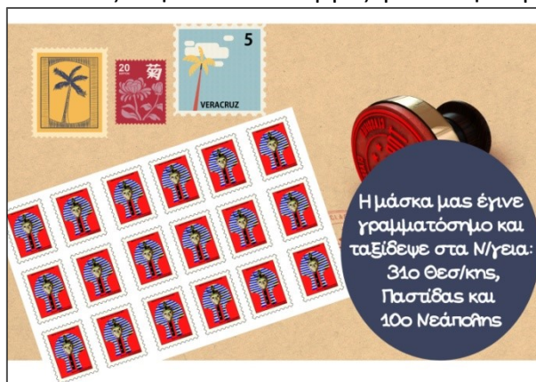
Εικόνα 3. Γραμματόσημα με τη μάσκα του Τουταγχαμών, Ν/γείο Πιπεριάς Πέλλας

Τα νήπια έλαβαν μήνυμα από τις μάσκες του προγράμματος Μήνυμα από την ποντικοπαρέα . Οι μάσκες μπήκαν σε ψηφοφορία και τα νήπια ψήφισαν αυτή που τους άρεσε περισσότερο. Οι μάσκες που επιλέχθηκαν από την πλειοψηφία των μαθητών έγιναν γραμματόσημα μέσω της εφαρμογής των ΕΛΤΑ και ταξίδεψαν στα συνεργαζόμενα Νηπιαγωγεία.